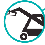
Diagramma di carico (EN1459-B) con stabilizzatori